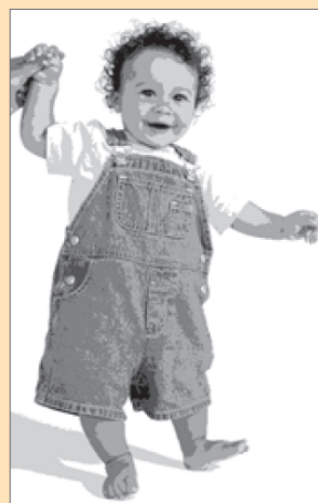
Toddler taking his first steps Michael age 11 months

If you live with or take care of people at risk, you should get vaccinated too. When you protect yourself, you help protect your family and friends.